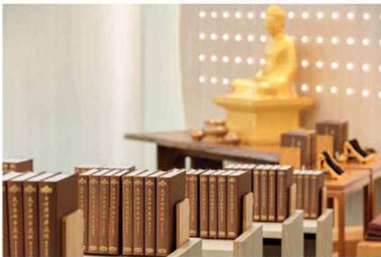
(法鼓山全球資訊網網站)

去年1月12日，在母親的告別式圓滿結束後，承蒙眾多師姐們的關懷與陪伴，讓我從失去至愛的恍惚與傷痛中，逐漸沉澱心情，回歸到安穩的生活軌道。即便我已在道場學佛近30年，面對這樣切身的無常，自己仍無法及時解開人生「八苦」之一的結。這次經歷讓我深刻體會到，與同參道友互為伴侶的重要性。